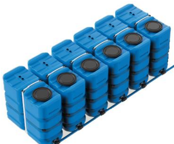
Exemple d'installation en batterie avec kits de jumelage